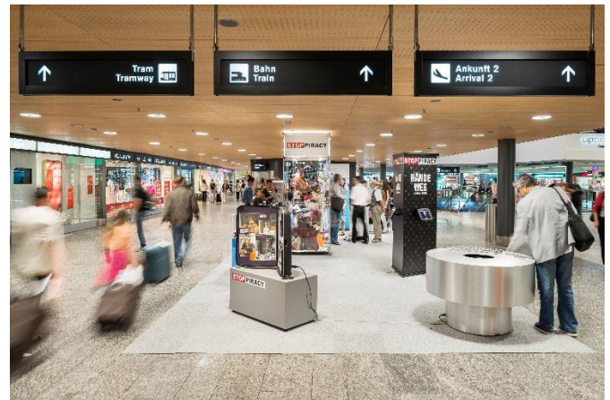
Bild: Ausstellung von Stop Piracy am Flughafen Zürich: Reisende werden auf die Problematik der Produktpiraterie – inklusive der gefälschten Zigaretten – aufmerksam gemacht.